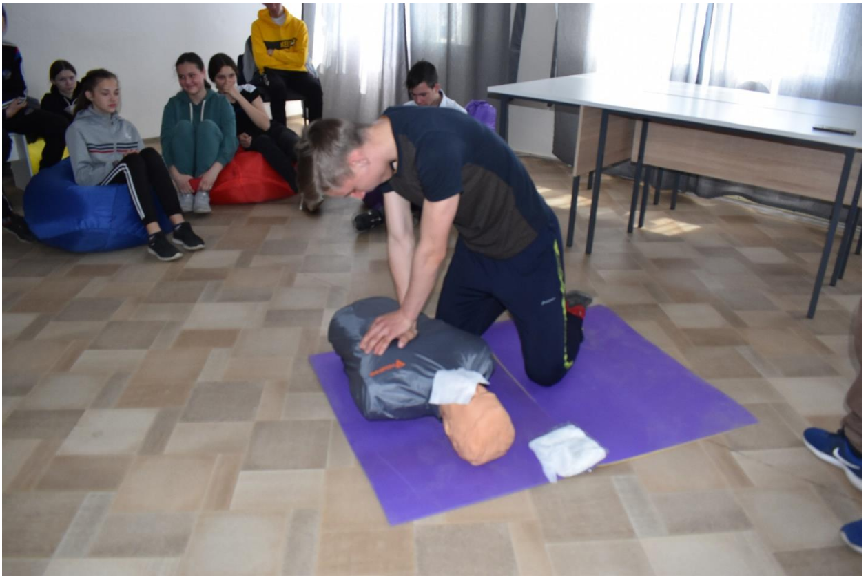
Занятие по оказанию первой помощи с участниками движения «Юнармия»