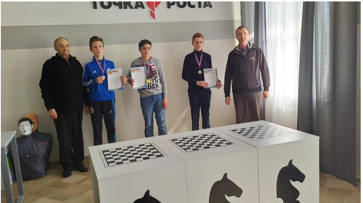
Победители районного турнира по шахматам