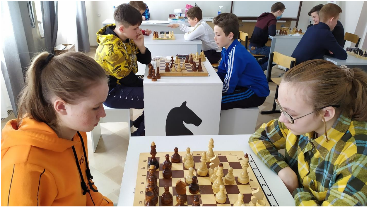
Районный турнир по шахматам