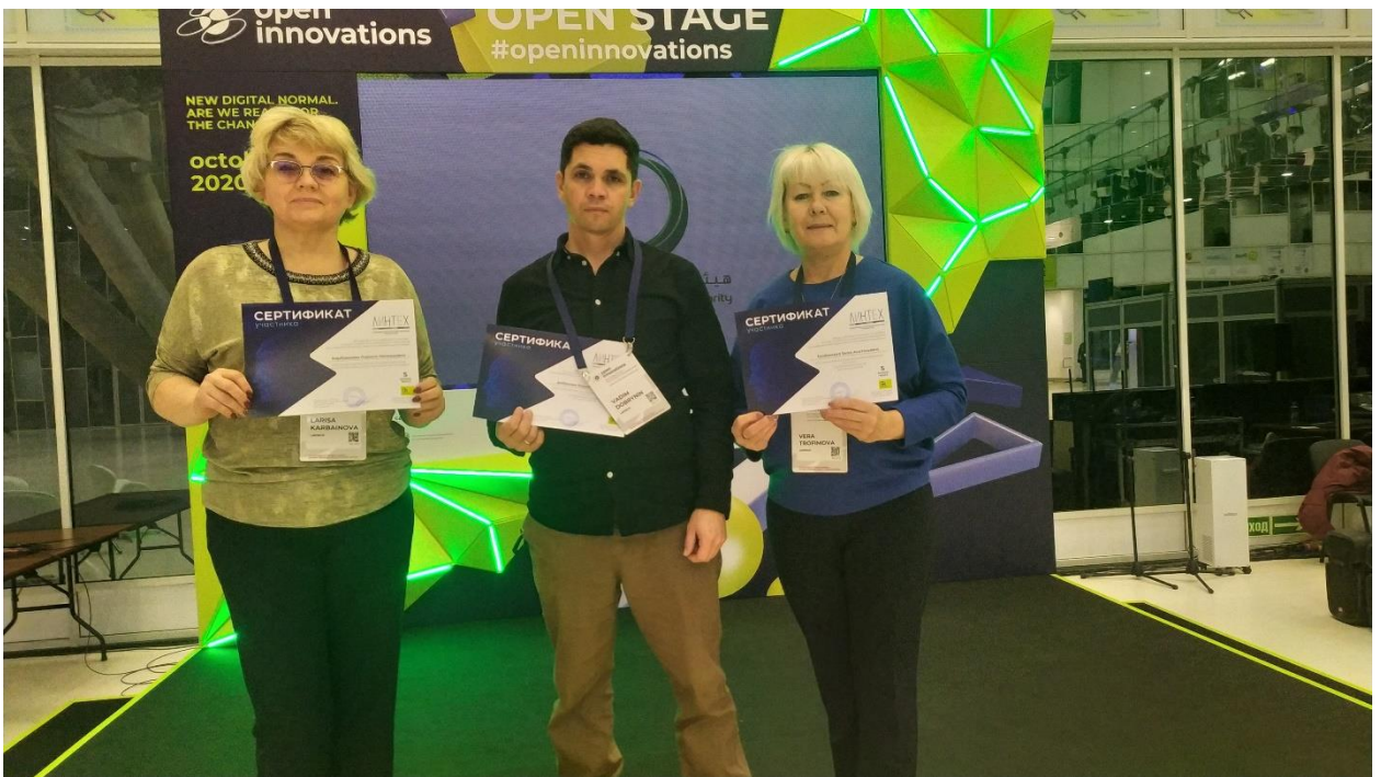
Курсовая подготовка, Сколково.